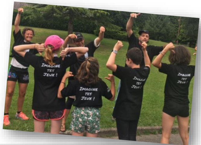
Collège de la Triouzoune à Neuvic